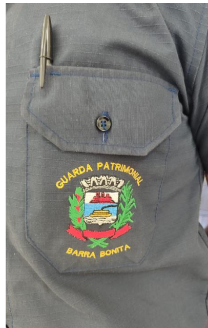
Item 13 - Jaqueta em tecido rip stop cor azul marinho.